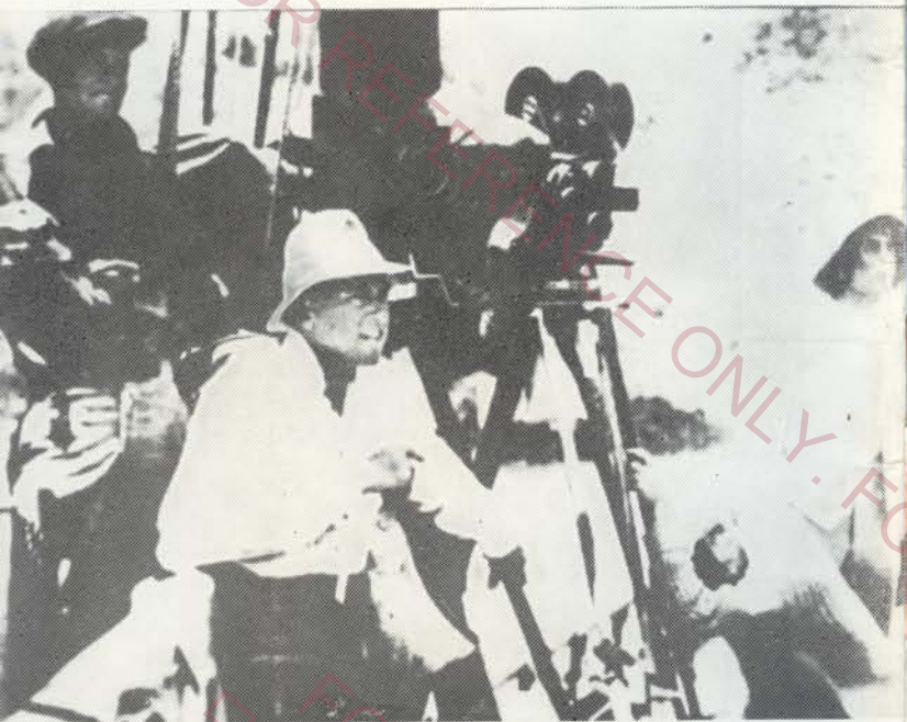
美国著名导演格里菲斯工作照